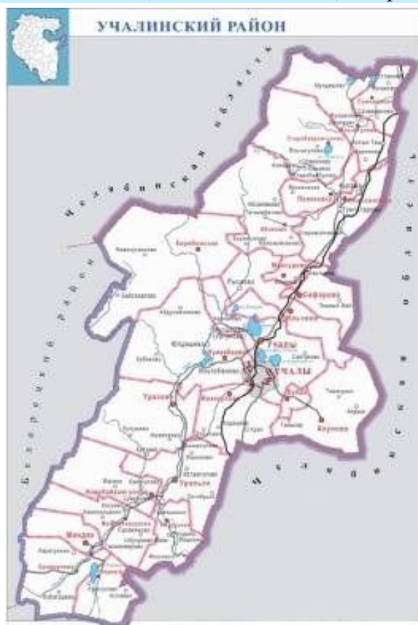
Карта муниципального района Учалинский район Республики Башкортостан